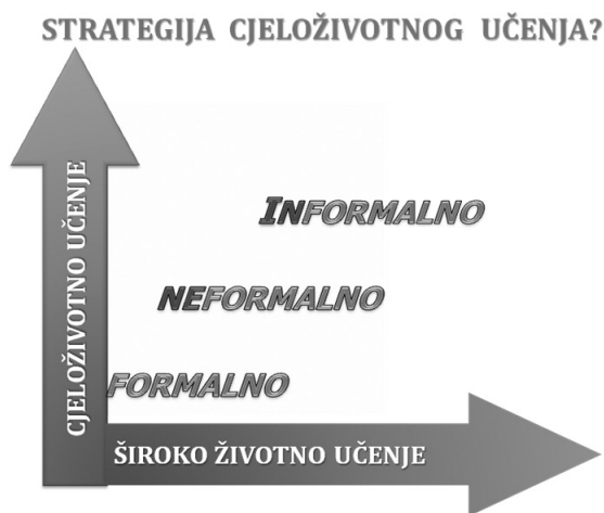
Grafik 1: Međusobni odnos obrazovanja

Pojam neformalnog obrazovanja sagledavamo kroz koncept obrazovanja za cijeli život, tj. cjeloživotno učenje. Uniju učenja predstavljam sljedećim grafikom.