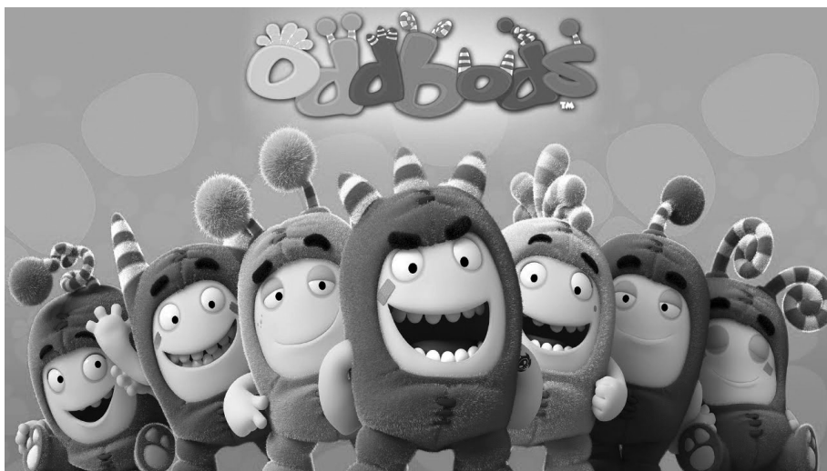
Slika 1. Oddbods 4

S ciljem dokazivanja ili opovrgavanja polazne pretpostavke, za ovo smo istraživanje izabrale uzorak od prvih 20 epizoda Oddbods a iz prve sezone. S obzirom da bi bilo logično, u tom smislu, govoriti o epizodama 1–20, ipak je riječ o onima 1–15 te 17–21. Naime, internetska stranica Oyo koja je omogućila gledanje animiranog filma vjerojatno je zabunom kopirala epizodu 15 koja je istovremeno i epizoda 16.